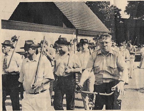
Polonaise der Fabianen durch Metelen.

Neben dem guten Wetter war es sicherlich auch die gute Stimmung an allen Schützenfesttagen, die für einen positiven Verlauf sorgten.